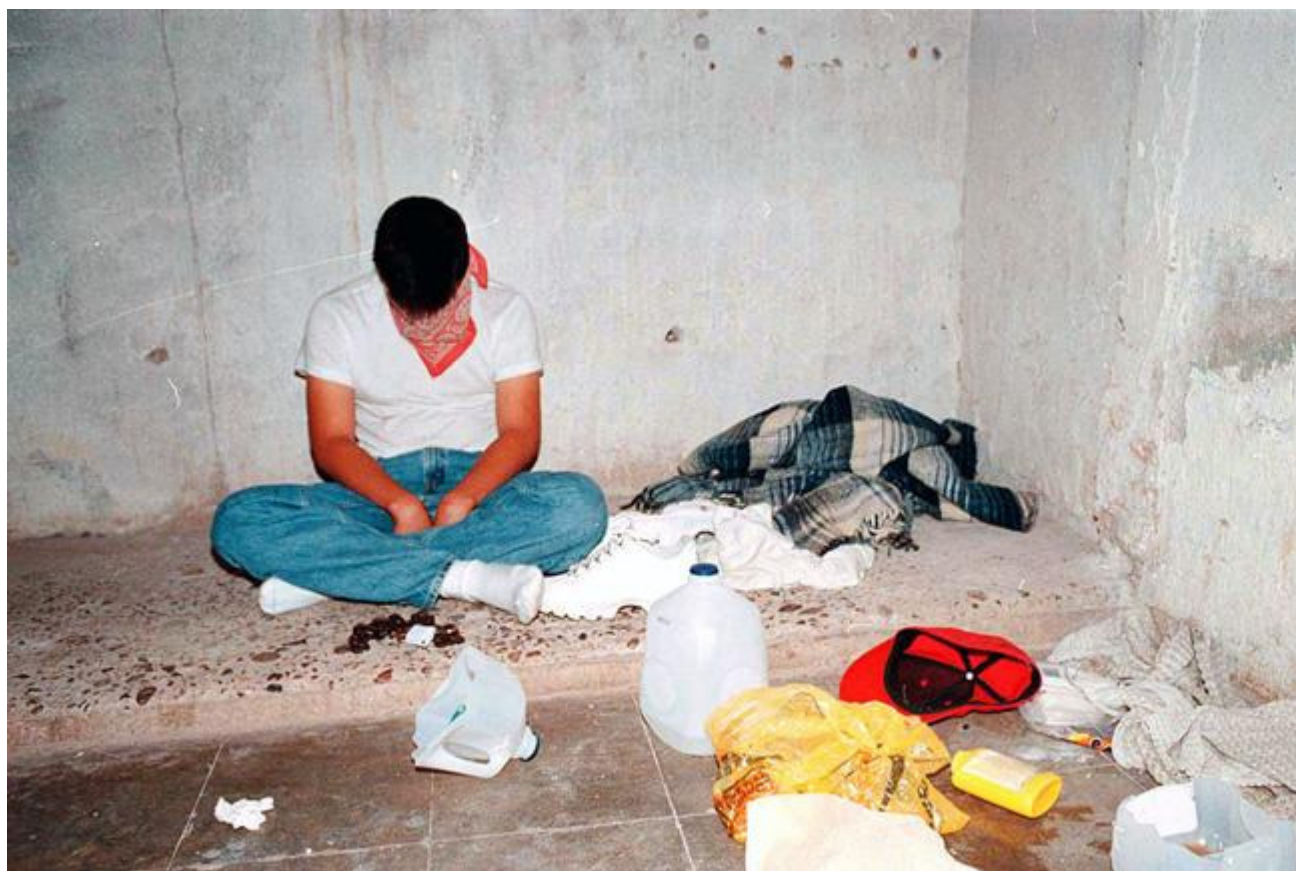
En México es difícil reconocer a un secuestrador, porque pueden vestir bien y vivir en zonas residenciales.